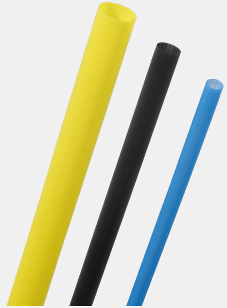
PTFE 热缩管提供收缩率为 2:1 和 4:1 的产品。

Zeus PTFE 热缩管的收缩率为 2:1 和 4:1。这些热缩管的使用温度上限为 260 °C (500 °F)，下限为 -200 °C (-328 °F)，是目前具有最广泛工作温度的产品之一。PTFE 热缩管具有优异的介电强度，非常适用于导线和电气组件的封装。户外使用时，PTFE 热缩管几乎完全不受天气的影响。我们的 2:1 PTFE 热缩管提供从 1/8 英寸到 1 英寸的分数尺寸，并提供 30 到 0 的 AWG 尺寸。我们的 2:1 PTFE 热缩管也可提供标准管、薄壁管、工业管和轻质管各种不同壁厚。